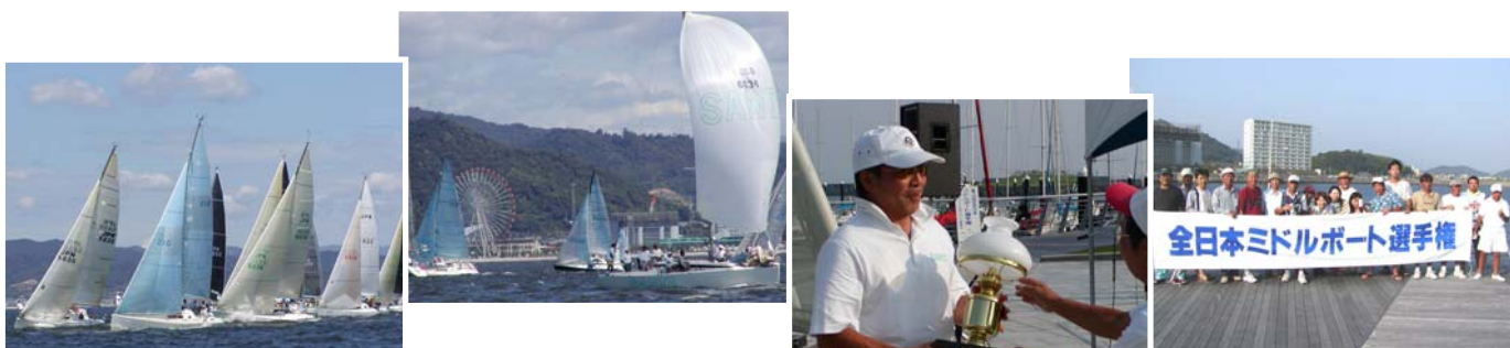
2003 第4回全日本選手権メモリアル